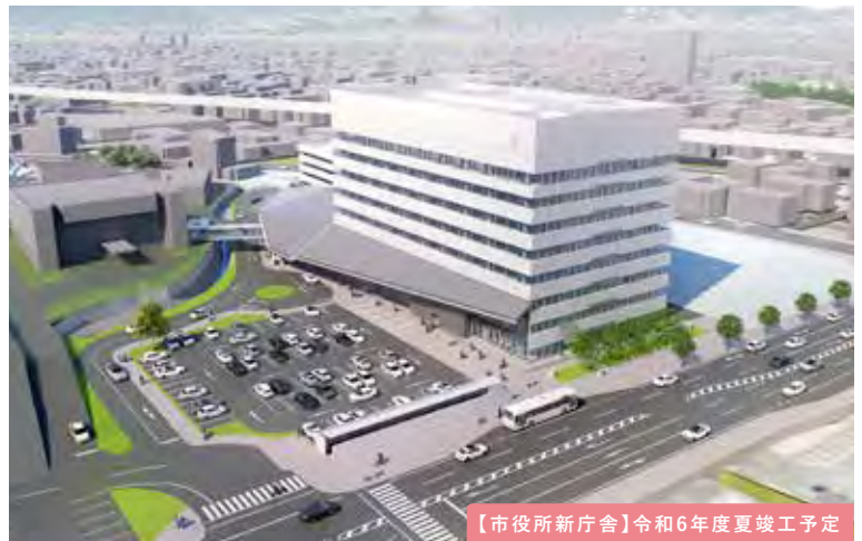
【市役所新庁舎】令和6年度夏竣工予定

利便性向上のため、関連組織の移転や窓口サービス等の低階層設置、デジタル化を推進します。8階には展望回廊を設置し、市民憩いの場を設けます。また、山口県防府総合庁舎や文化福祉会館機能、警察署の移転も予定しており、より利便性の高い庁舎となります。